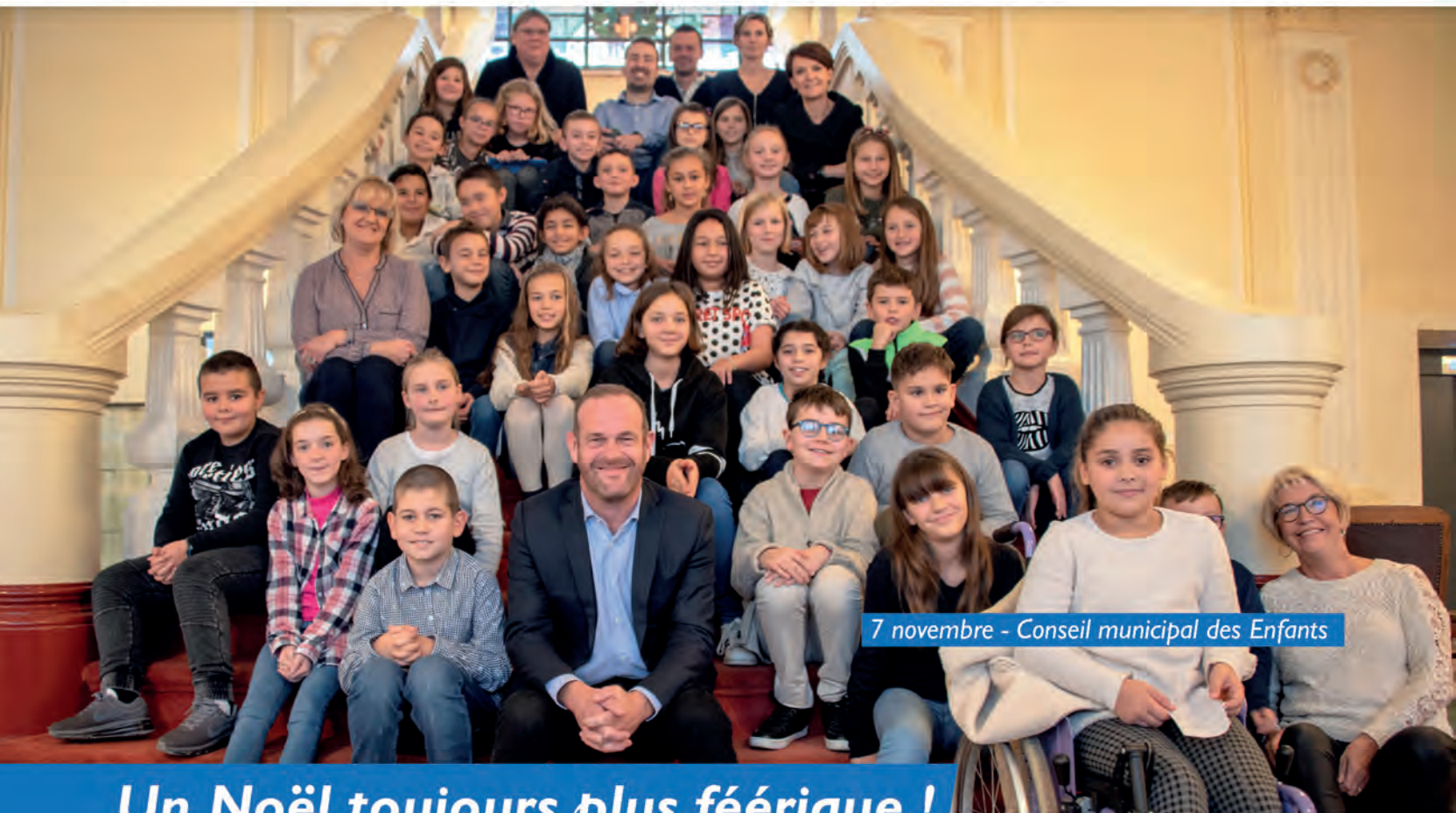
7 novembre - Conseil municipal des Enfants