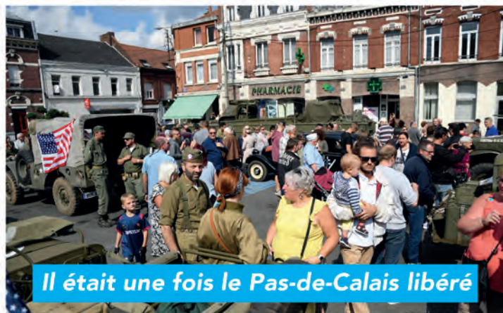
Il était une fois le Pas-de-Calais libéré