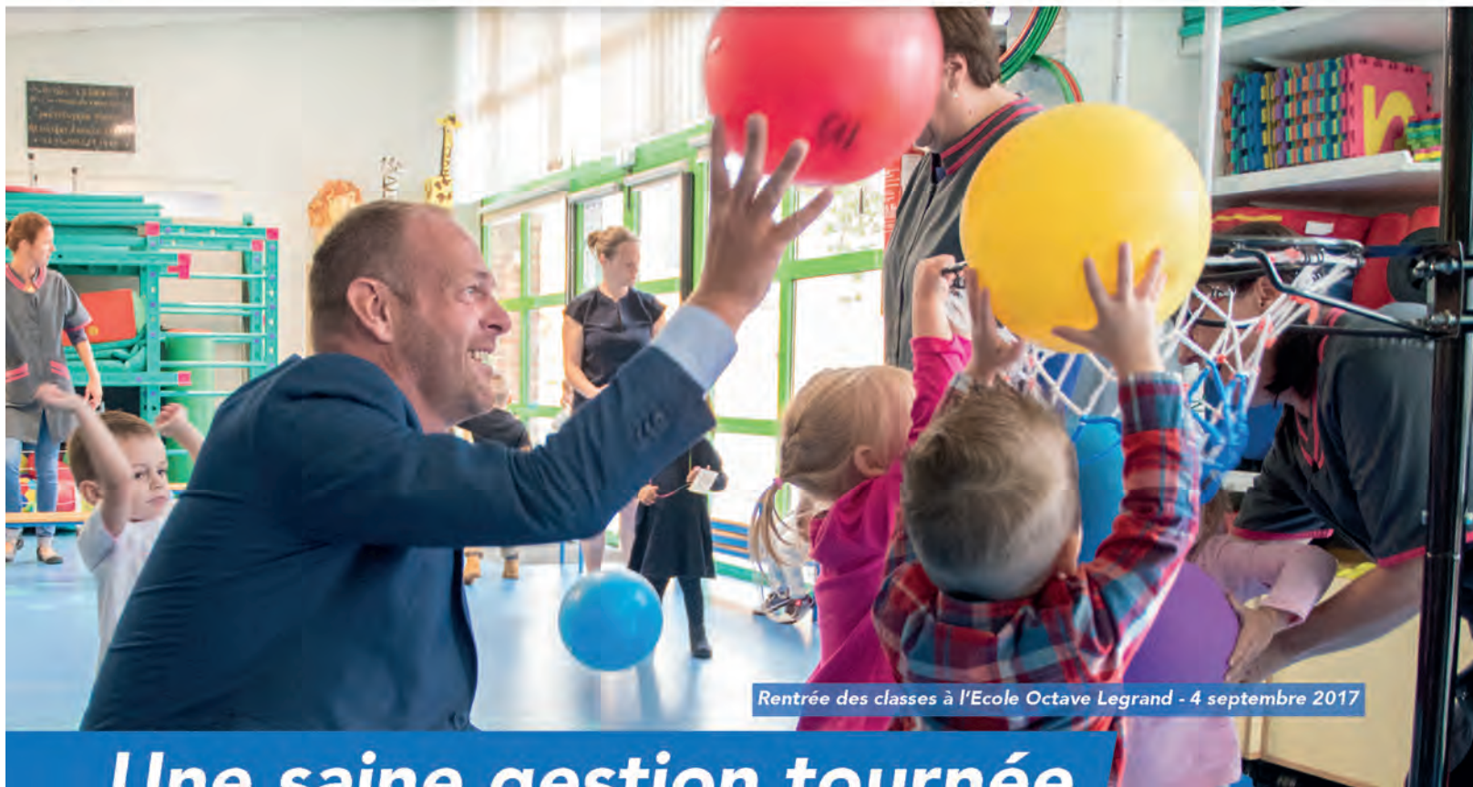
Rentrée des classes à l'École Octave Legrand - 4 septembre 2017