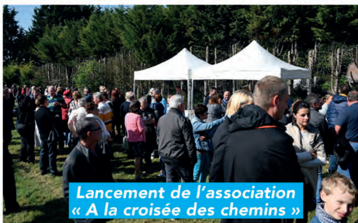
Lancement de l'association « A la croisée des chemins »