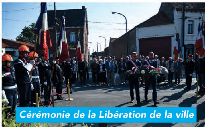
Cérémonie de la Libération de la ville