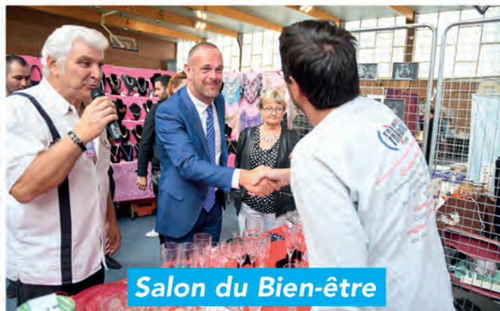
Salon du Bien-être