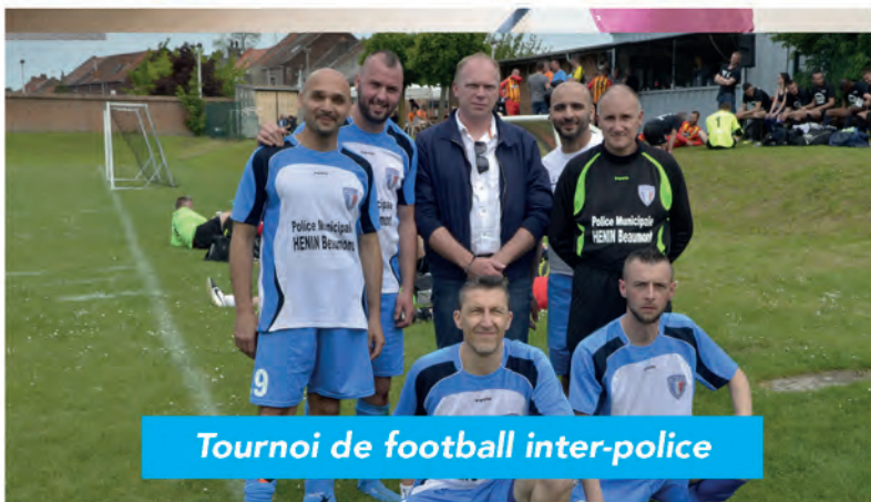
Tournoi de football inter-police