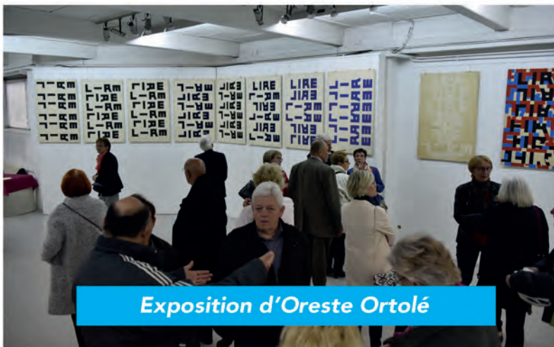
Exposition d'Oreste Ortolé