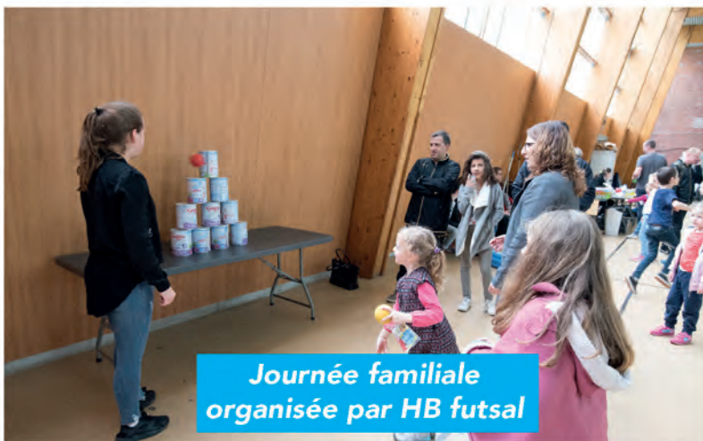
Journée familiale organisée par HB futsal