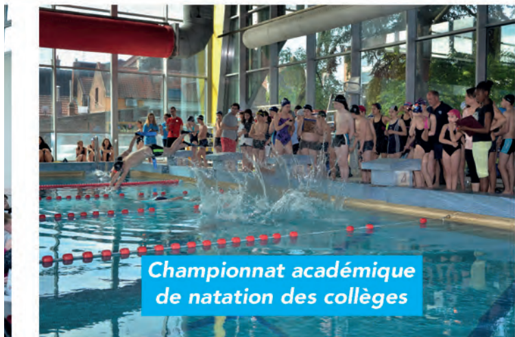
Championnat académique de natation des collèves