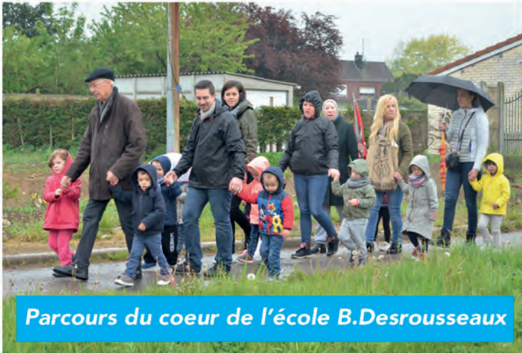
Parcours du coeur de l'école B.Desrousseaux