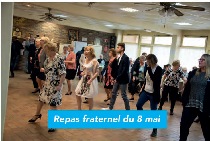
Repas fraternel du 8 mai