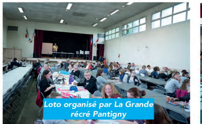
Loto organisé par La Grande récré Pantigny