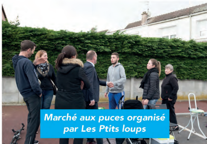
Marché aux puces organisé par Les P'tits loups