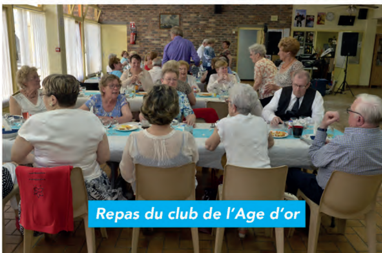
Repas du club de l'Age d'or