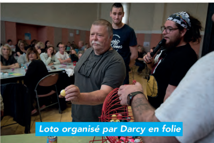
Loto organisé par Darcy en folie