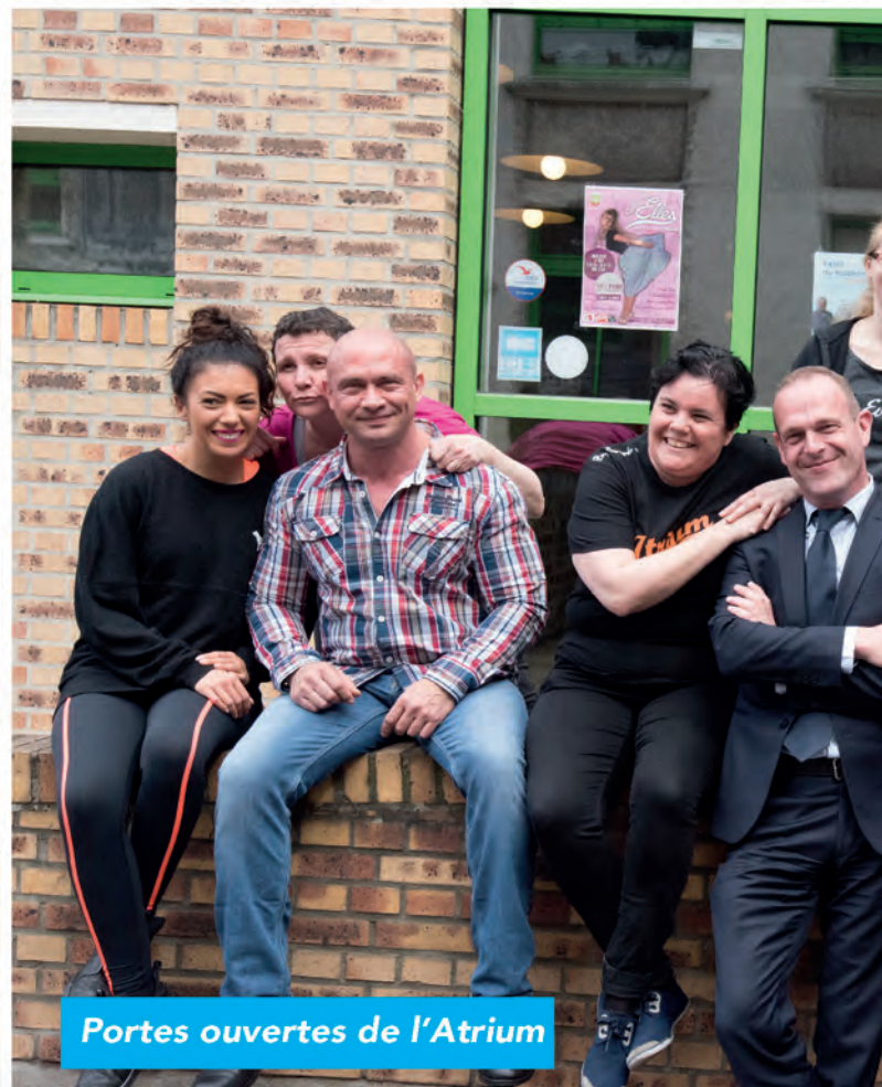
Portes ouvertes de l'Atrium