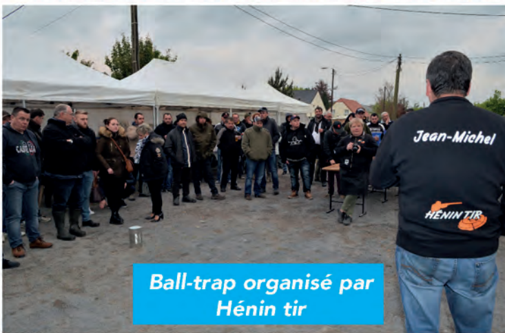
Ball-trap organisé par Hénin tir