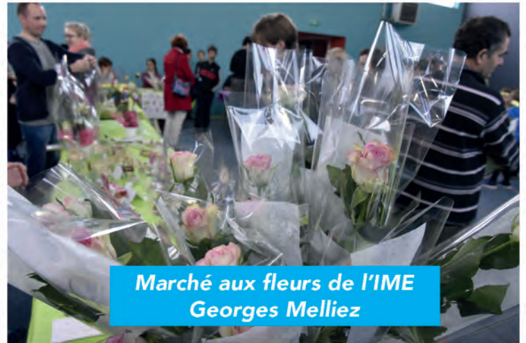
Marché aux fleurs de l'IME Georges Melliez